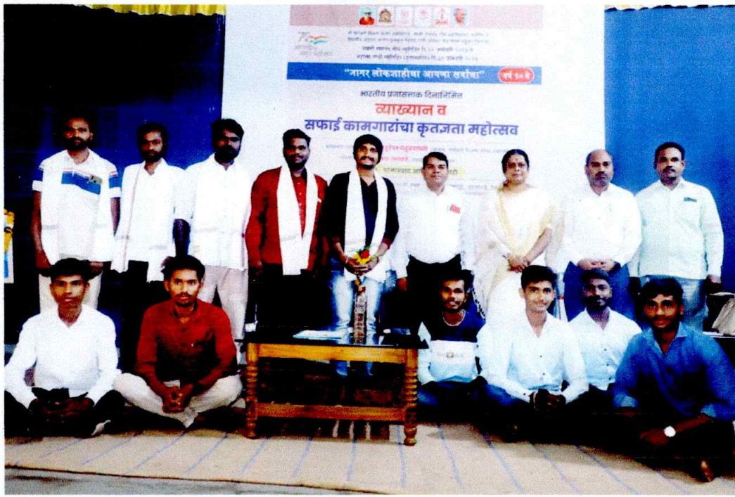
Group photograph with Sweepers, Students and faculty members.