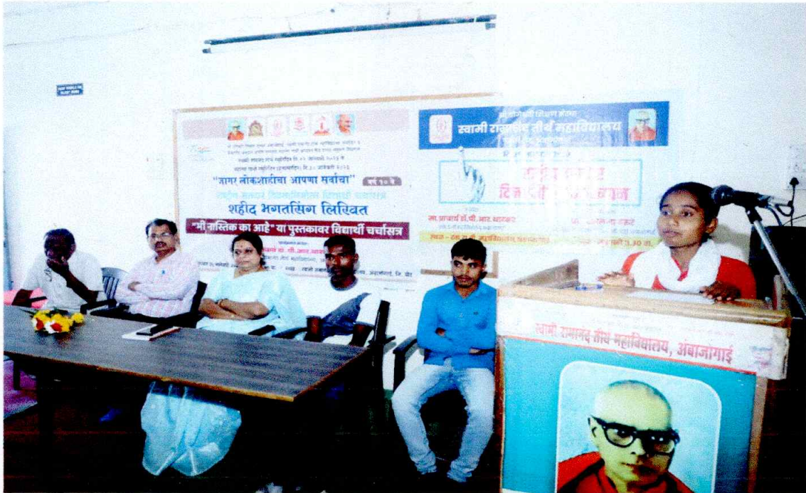
Participants presenting their Seminar on Book of Shahid Bhagatsingh Written “Mi Nastik Aahe ka” on 25 th January, 2023.