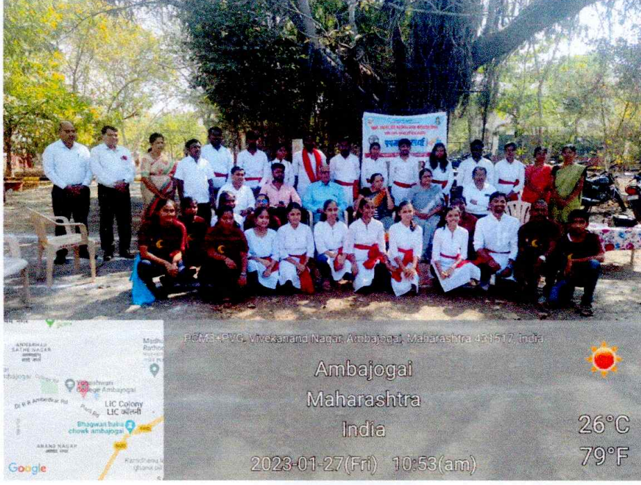
Group Photograph with all Participants of Street Play Competition