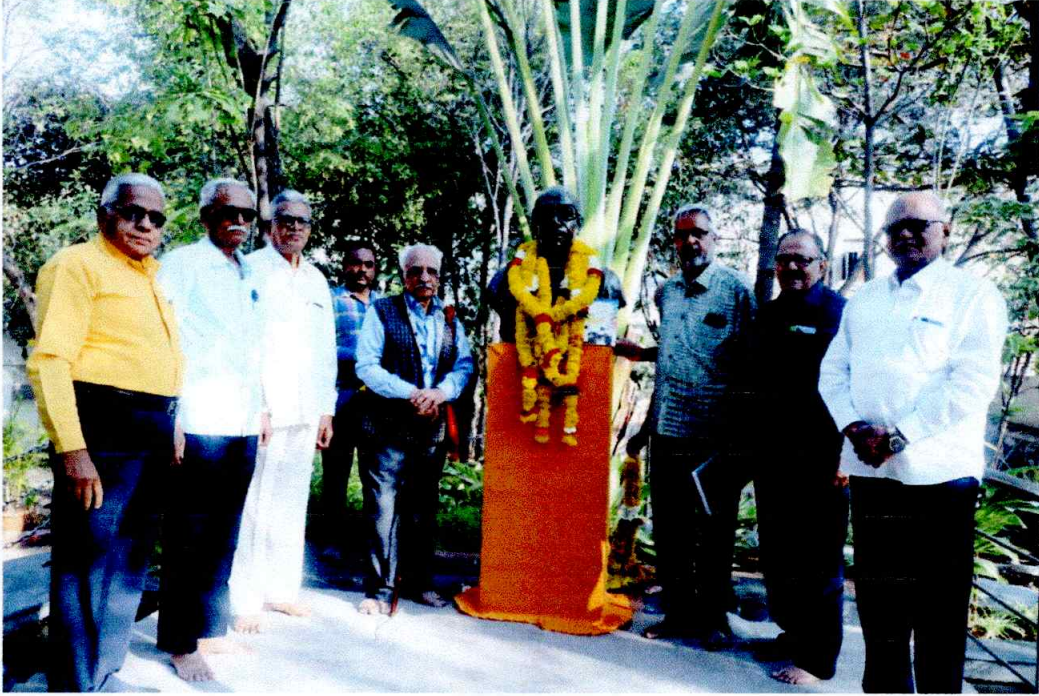
All dignitaries While offering floral tributes to the statue of Swami Ramanand Teerth.