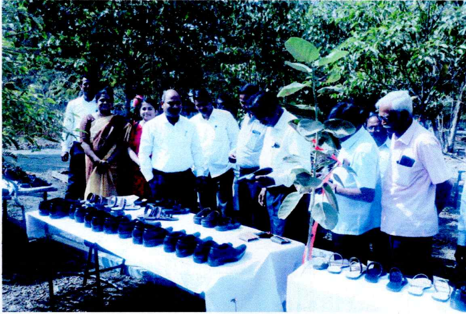
Exhibition of Shoes on the occasion of 'Jagar Lokshahicha Aaplya Sarwnacha' on 24 th January, 2023.