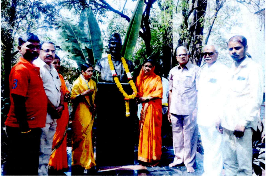
All dignitaries with sweepers While offering floral tributes to the statue of Swami Ramanand Teerth.

गुरुवार दि. २६ जानेवारी २०२३, सकाळी ११.०० वा. स्थळ : नागापूरकर सभागृह, अंबाजोगाई, जि. बीड