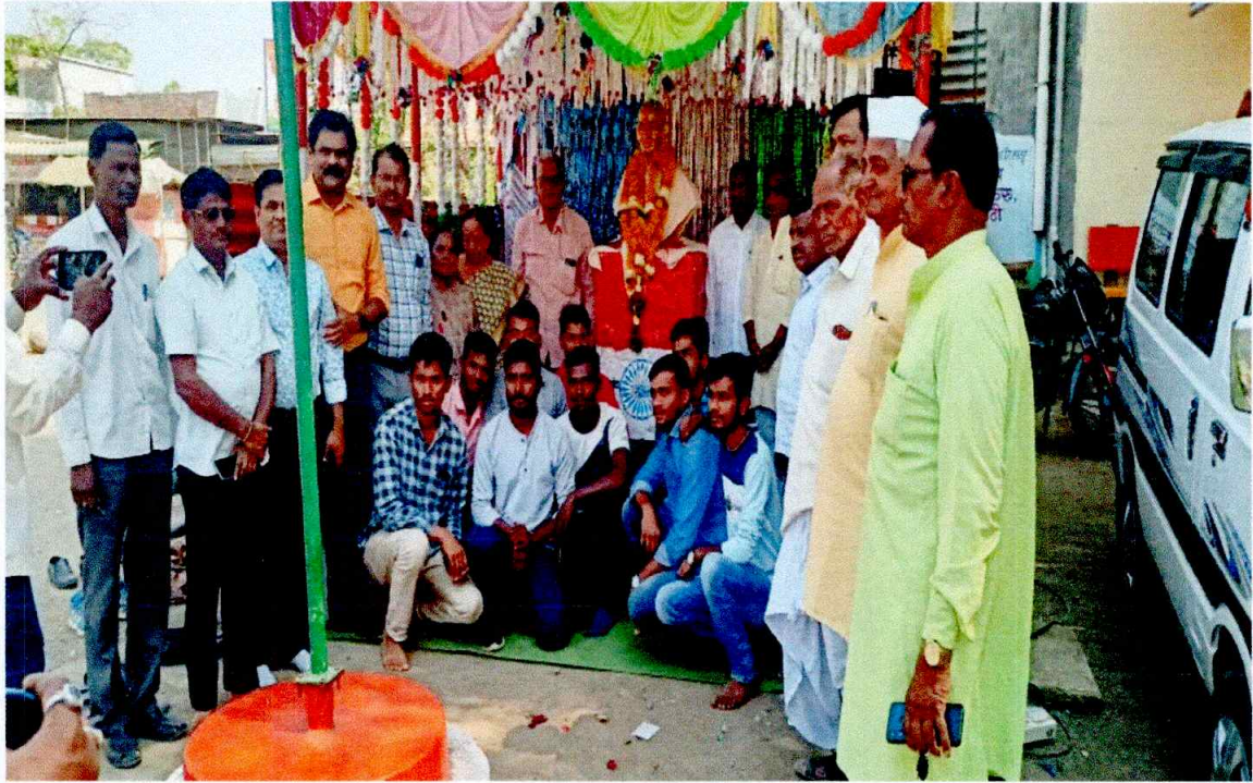
Group Photograph on Ujed.