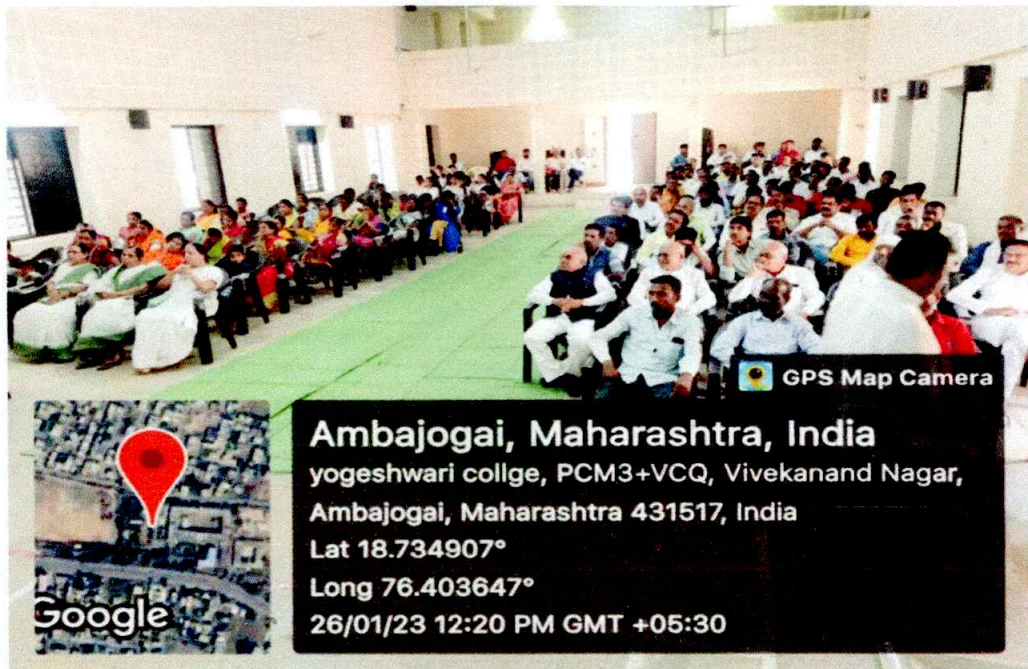
All Participants of a lecture on 'Marketism and Democracy' and Gratitude festival of the sweepers