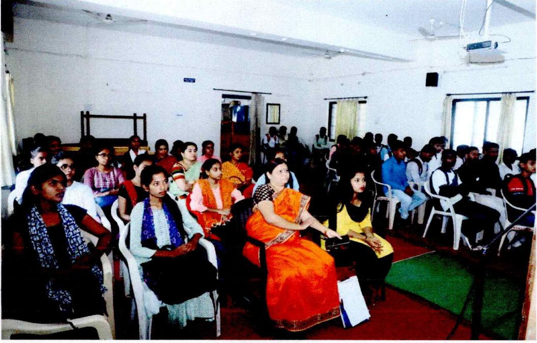
Participants of Students Seminar on Book of Shahid Bhagatsingh Written "Mi Nastik Aahe ka"