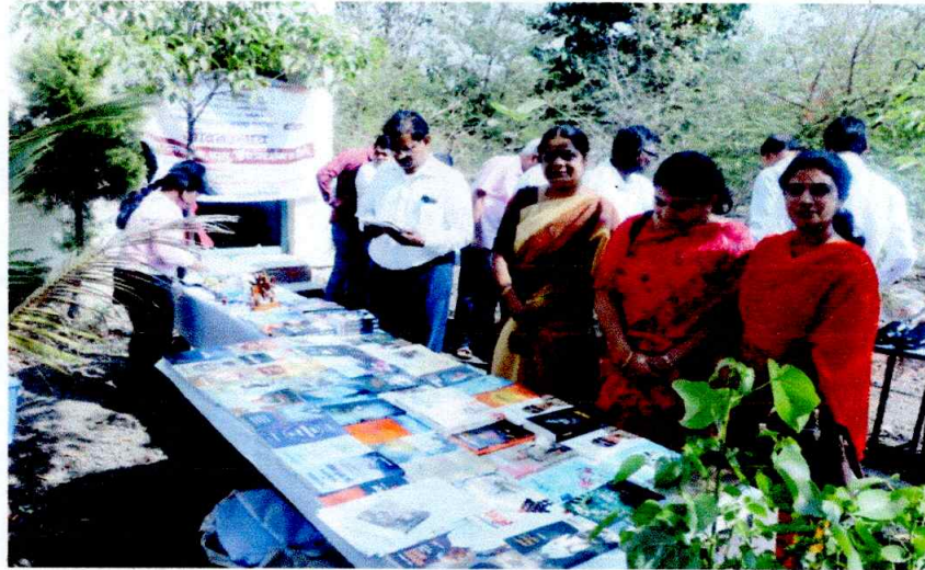
Exhibition of Books on the occasion of 'Jagar Lokshahicha Aaplya Sarwnacha' on 24 th January, 2023.