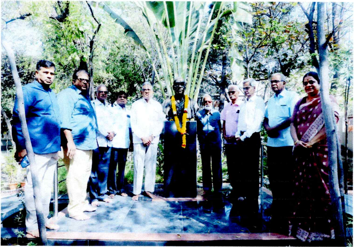
All dignitaries While offering floral tributes to the statue of Swami Ramanand Teerth.