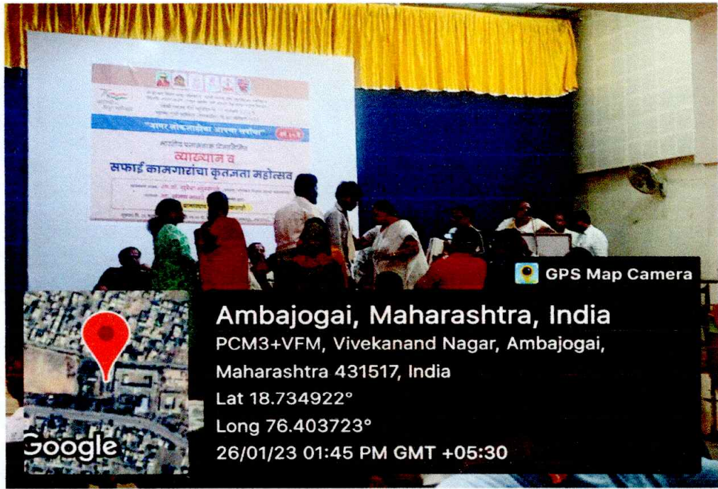
Gratitude festival of the sweepers