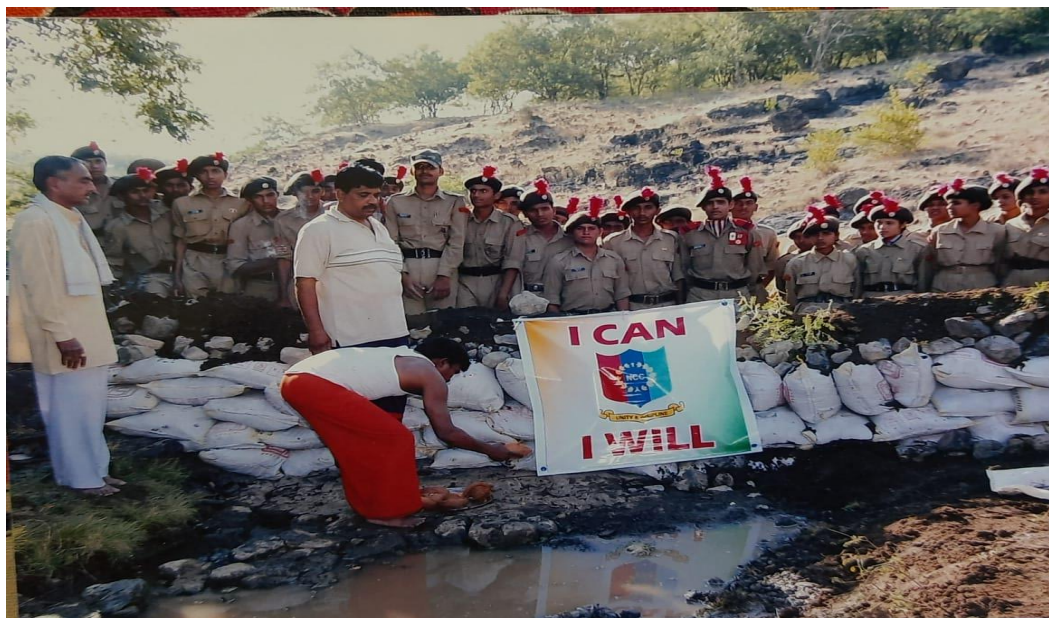
N.C.C. Cadets developed the Dams (Bunds) in Mukundraj Area