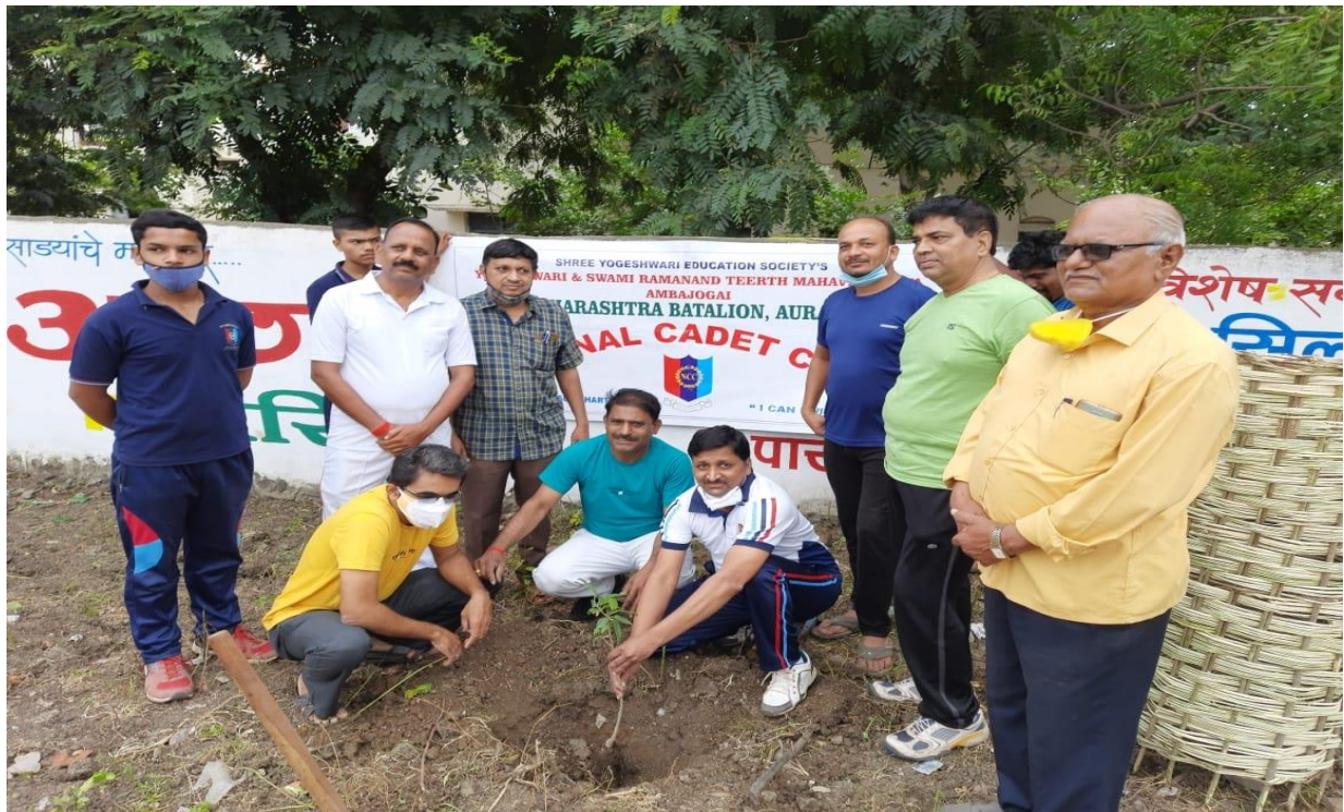
Tree Plantation by N.C.C. Officers and Cadets