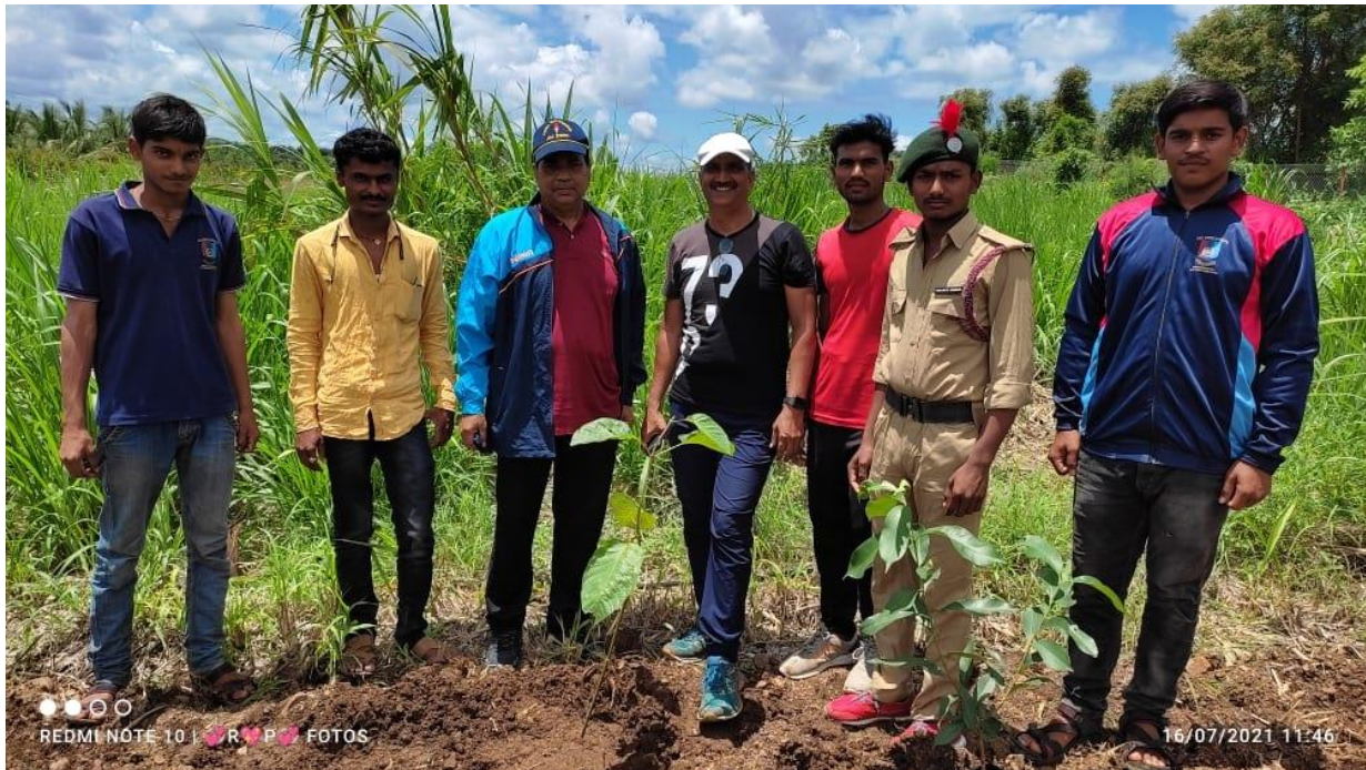
Tree Plantation by N.C.C. Officers and Cadets