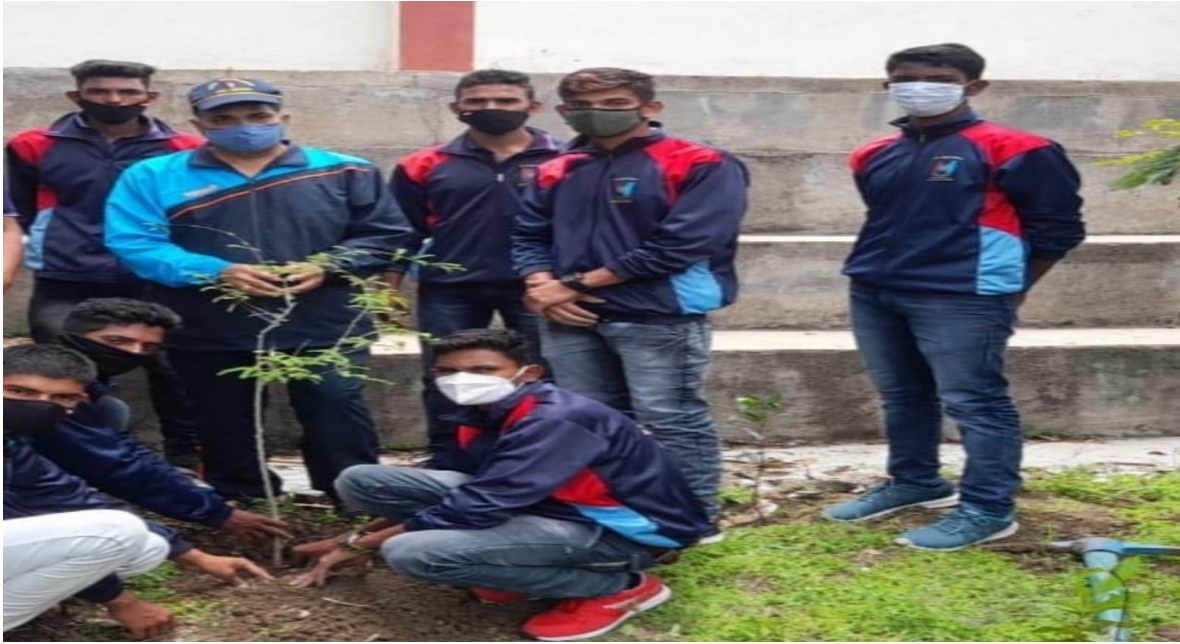
Tree Plantation by N.C.C. Officers and Cadets