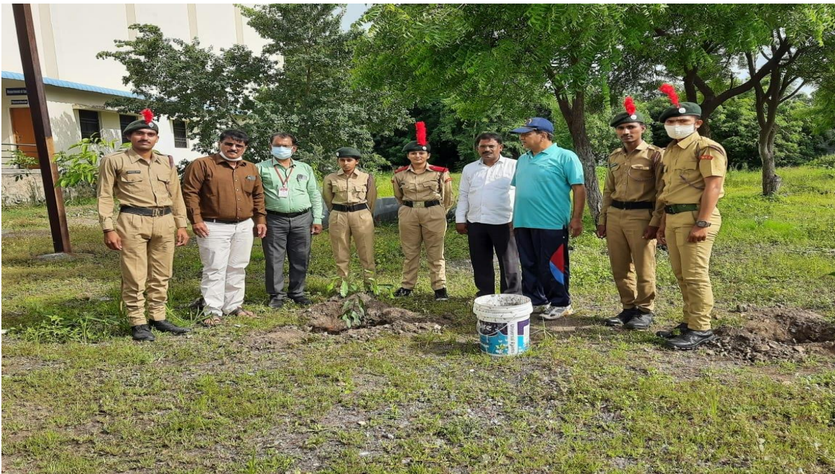
Tree Plantation by N.C.C. Officers and Cadets