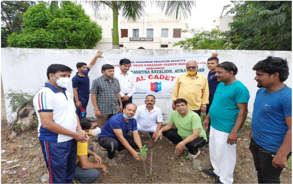
Tree Plantation by N.C.C. Officers and Cadets