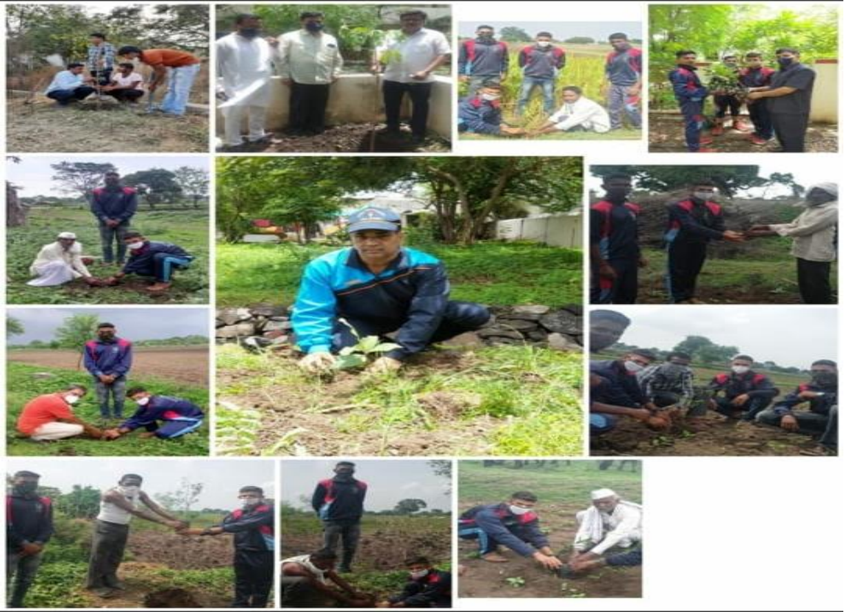
Tree Plantation by N.C.C. Officers and Cadets