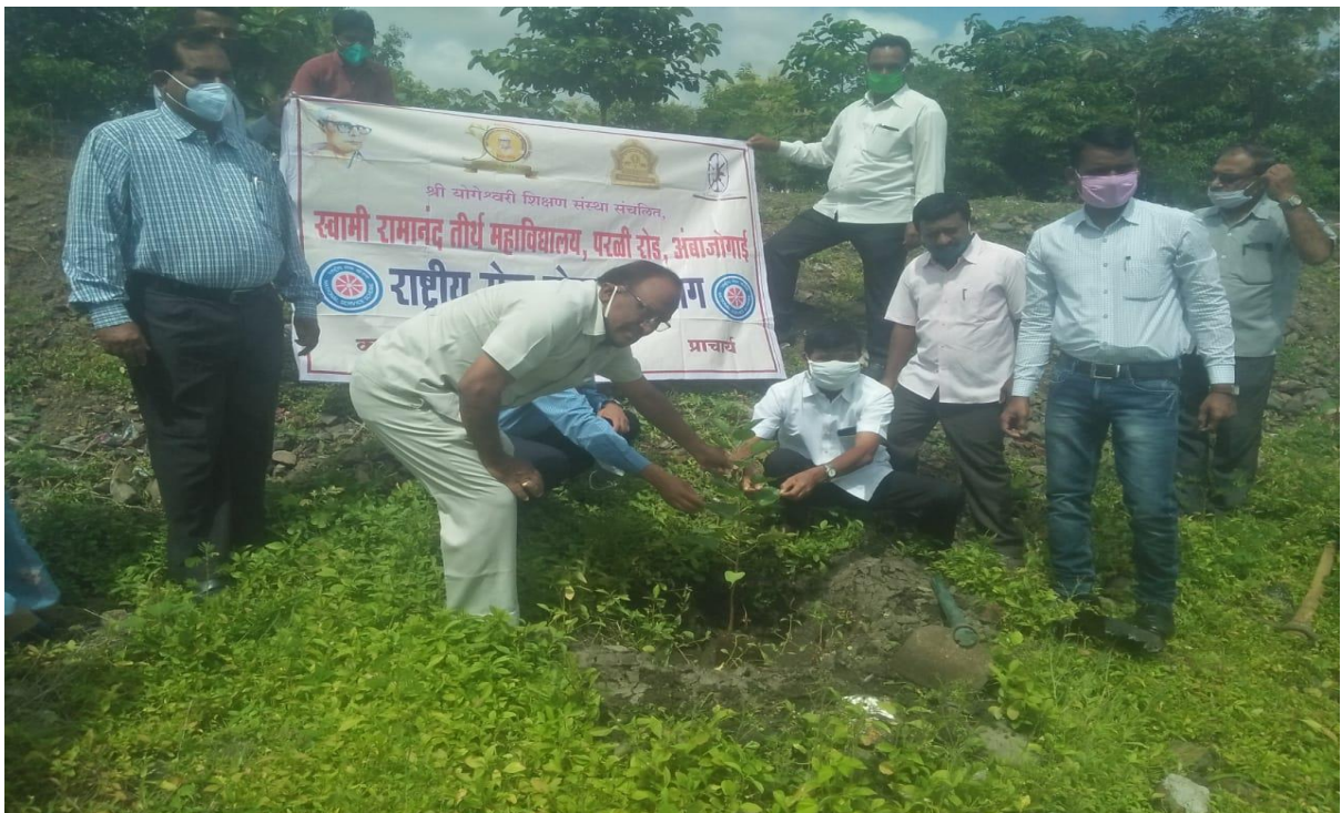
Tree Plantation by N.S.S. Volunteers